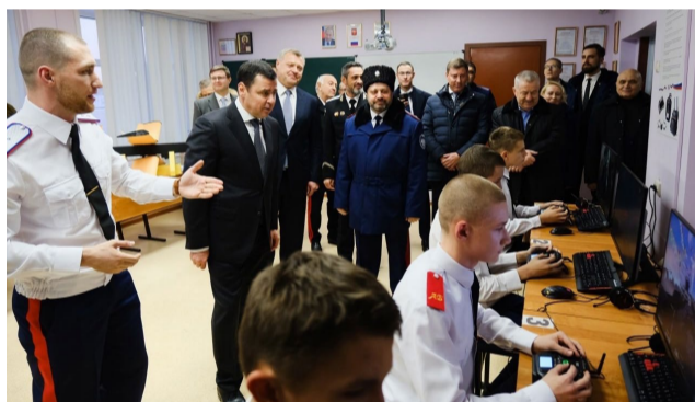
Казачий кадетский корпус имени атамана И.А. Бирюкова в Астрахани с рабочим визитом посетили представители Совета при Президенте Российской Федерации по делам казачества во главе с председателем Совета, помощником Президента РФ Дмитрием Мироновым.

Губернатор Астраханской области Игорь Бабушкин, в свою очередь, сообщил, что в регионе официально зарегистрированы 17 казачьих обществ. Их представители участвуют в охране общественного порядка и государственной границы, занимаются вопросами патриотического